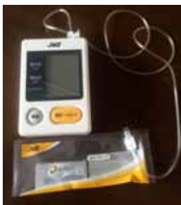
←舌圧計 舌の筋力を測定できる専用キットです。舌は食べ物や飲み込む時にも大切な役目をしています。

カラオケや歌などで声を出すことの多い方は、のどの周りの筋力も保たれています。また、お口だけでなく、食事の姿勢を整える全身の筋力も大切です。体操もおすすめです。