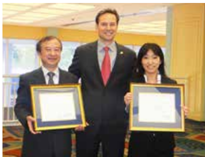
米国歯周病学会・臨床研究賞を受賞。

ライオン歯科衛生研究所の調査研究活動は、文部科学省から科学研究費認定機関として高い評価を受けているが、今回の米国・欧州ダブル受賞により世界からも大きな注目を集めることとなった。