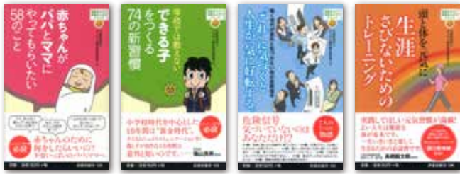
「健康をみかく笑顔をふやすシリーズ」は、コンパクトな新書版サイズで約200ページ。イラストを多用したわかりやすい構成になっている。