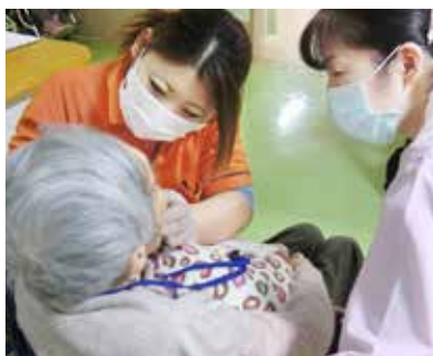
口腔を清潔に保つことが、高齢者の健康寿命の延伸につながる。

例えば、京都府の京丹後市と大阪府の寝屋川市の特別養護老人ホームでは、オーラルケアによって誤嚥性肺炎を予防する取り組みを実施している。高齢者は、食べ物を飲み込む時、誤って気道に入ってしまうことがあり、その際、口の中や入れ歯が清潔に保たれていないと肺に雑菌が入り肺炎を引き起こす恐れがある。そこで、お年寄りや施設職員に口腔清掃の指導をすることで、肺炎予防につなげる活動を実施。有用なケア方法を全国に展開することで、健康寿命の延伸に貢献している。